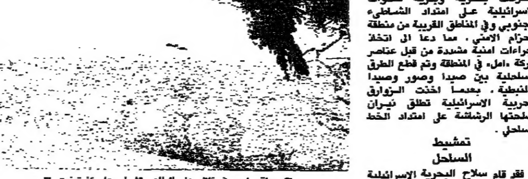
مواقع لحد في تلال على الطاهر تشرف على كفرتبتت

كفرتبتت - من نزبه نقوزي: شهدت المنطقة الجنوبية اسم تحركات بحرية وسيرة للقوات الاسرائيلية في امتداد الشاطئ الجنوبي وفي المناطق القريبة من منطقة الحزام الاسمي. مما دعا الى اتخاذ اجراءات امنية مشددة من قبل عناصر حركة امل. في المنطقة وتم قطع الطرق السليمة بين صيدا وصور وصيدا والناظية. بعدما اخذت الزوارق الحربية الاسرائيلية تطلق نيران اسلحتها الرشاشة على امتداد الخط السلي.